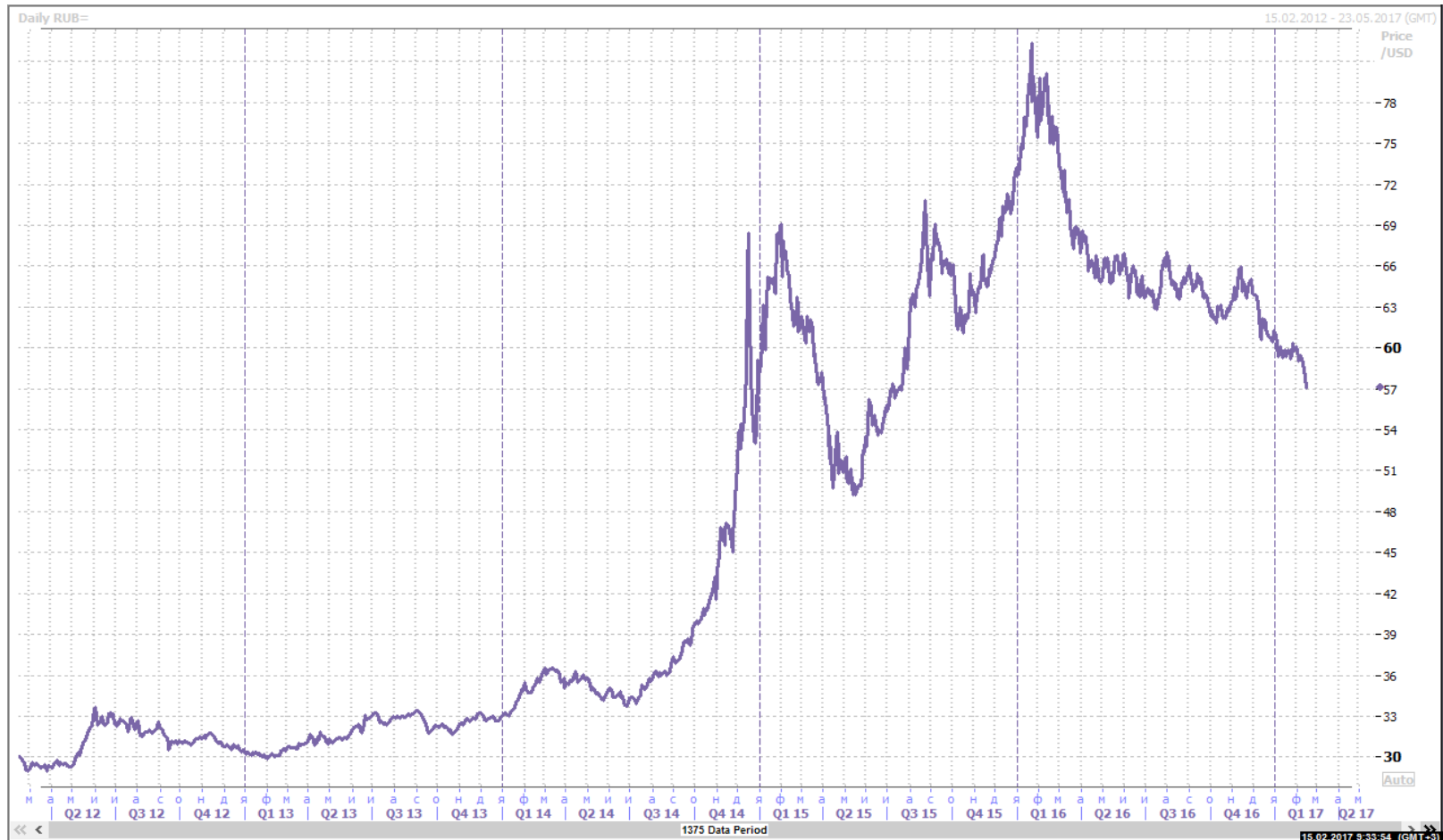
Курс USD/RUB с 2012 года по данным Reuters

Хеджирование необходимо для бизнеса в условиях нестабильного курса валют.